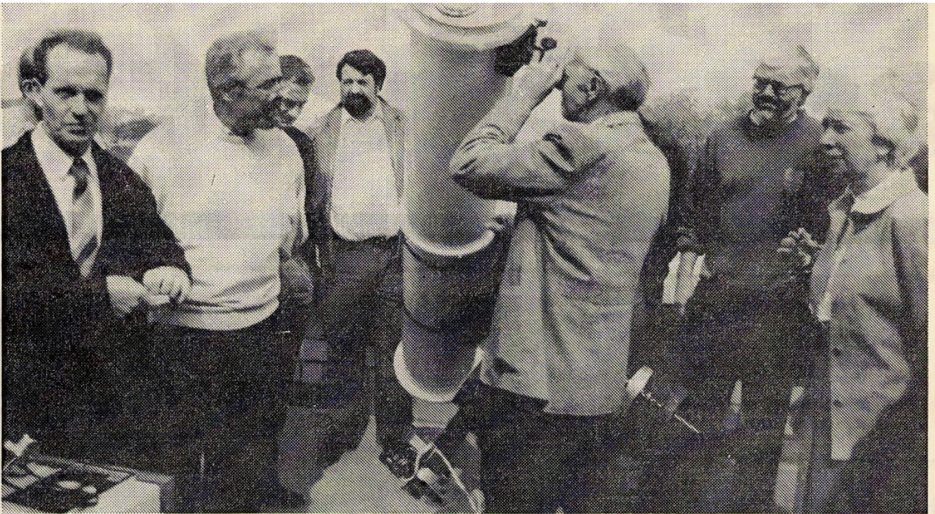
Detmold. Das Spiegelteleskop auf dem Dach des „Leopoldinum“ steht Gymnasiasten und Realschülern gleichermaßen zur Verfügung. Die Sternwarte ist ein Geschenk der Fördervereine beider Schulen.