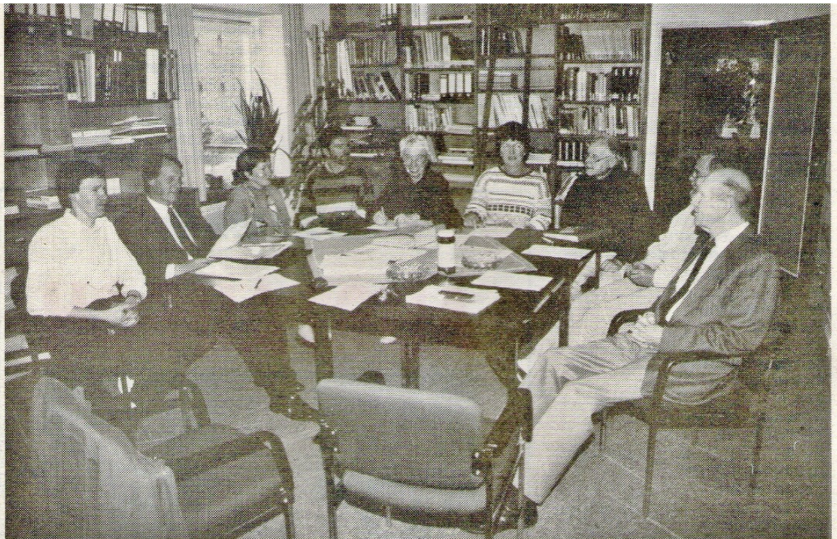
Neue Pläne werden geschmiedet, alter und neuer Vorstand beraten in der Lehrbücherei.