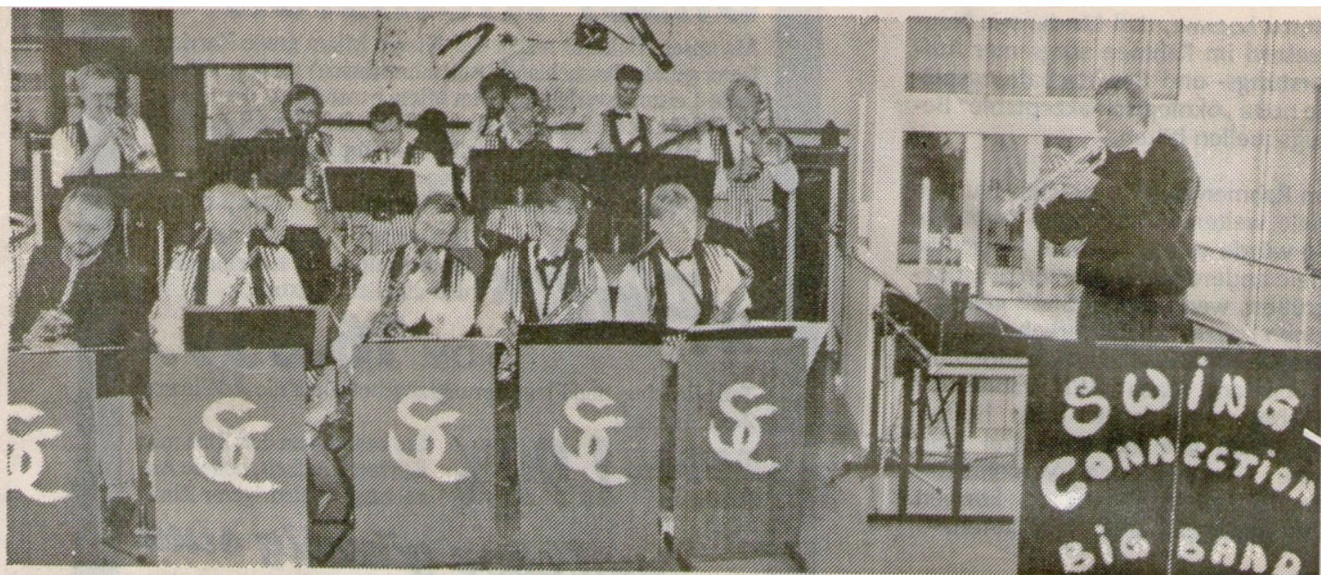
Detmold. Die „Swing Connection Big Band“ sorgte mit flotten Rhythmen für Unterhaltung beim Schulfest der Realschule I.