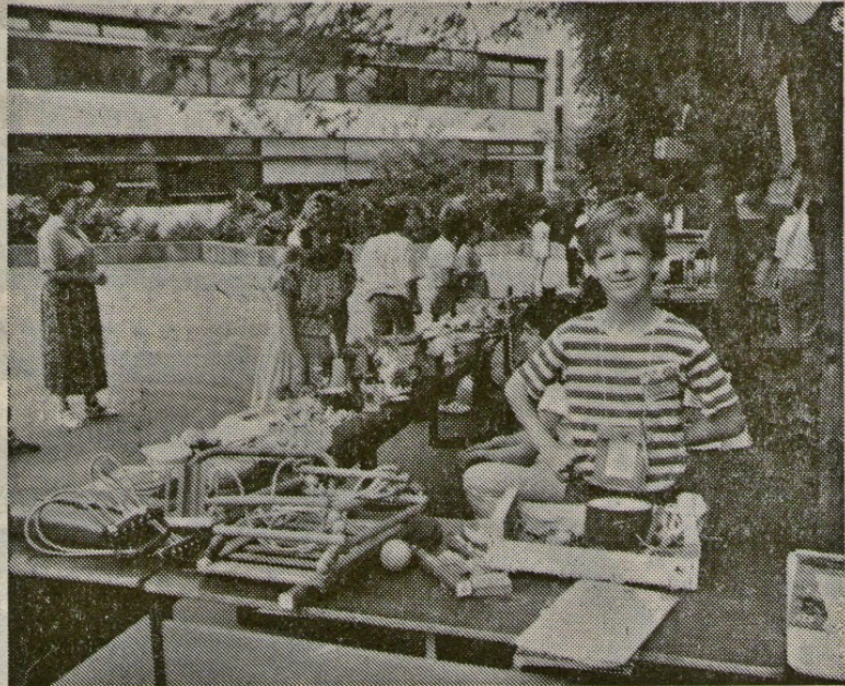
Nicht ohne Stolz präsentiert hier ein Flohmarkt-Fan seine Kostbarkeiten. Auf dem Schulhof konnte alles und jenes gekauft werden.